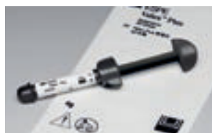
Recharge Valux™ Plus