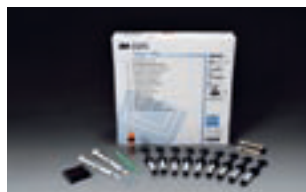
Coffret d'introduction Valux™ Plus